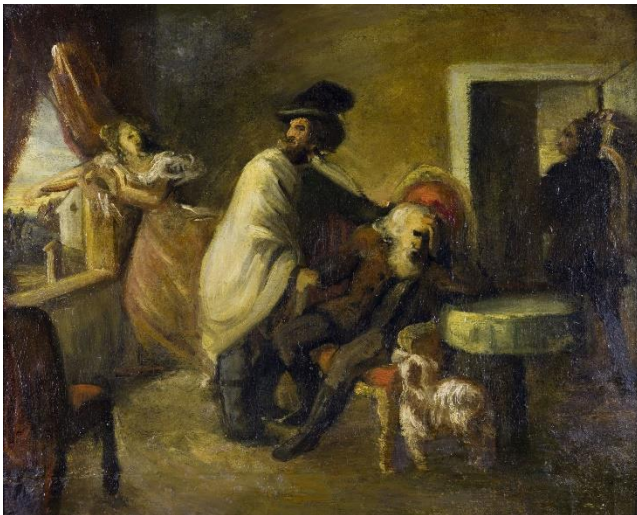
A gerillakapitány búcsúja