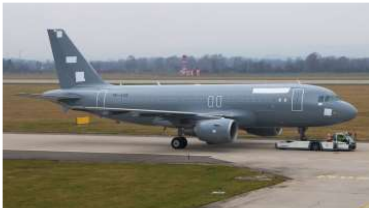
Airbus A319 - Szállító repülógép (2 db)