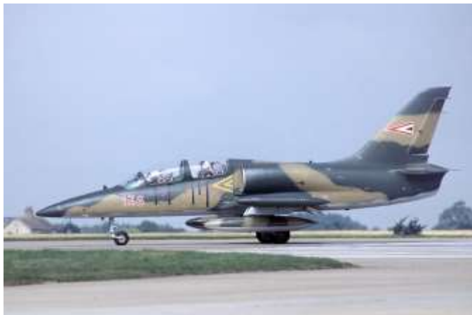
L-39 , kivonták