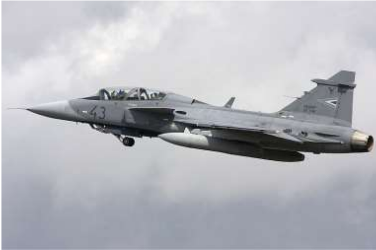
2 db JAS 39 EBS HU D Gripen – kétüléses többcélú negyedik generációs vadászipülógép.