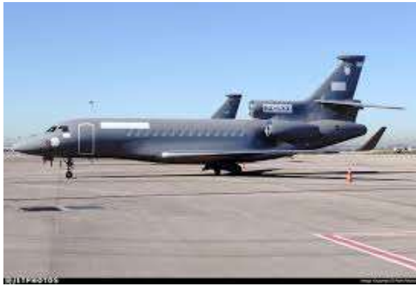
Dassault Falcon 7X - Könnyű szállító repülógép (2 db)