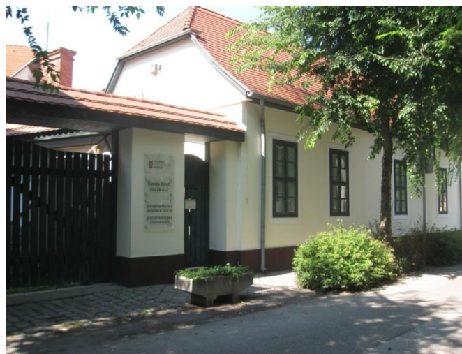
Katona József szülőháza