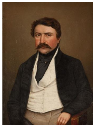
Deák Ferenc A, C