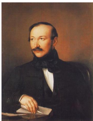
Vörösmarty Mihály D, F