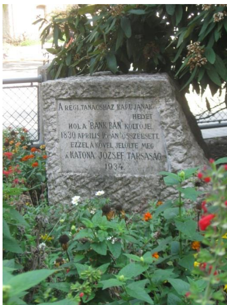
Katona emlékkő (Városháza előtt )