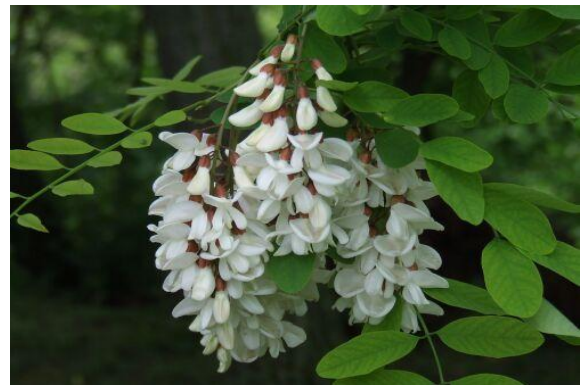
J: Fehér akác 10p