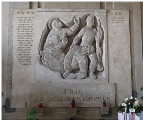
Helyszín: Parista Gimnázium