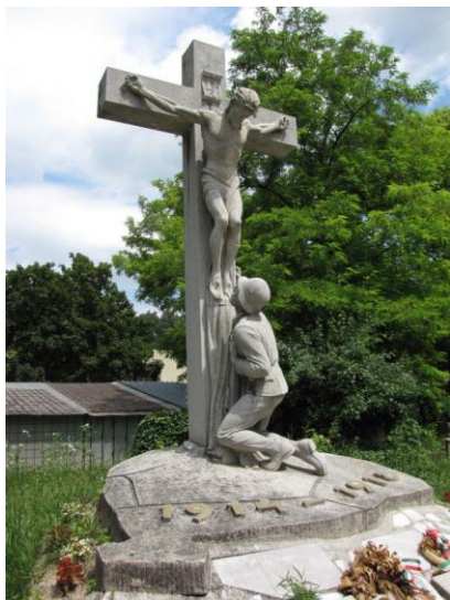
Helyszín: Szentháromság temető