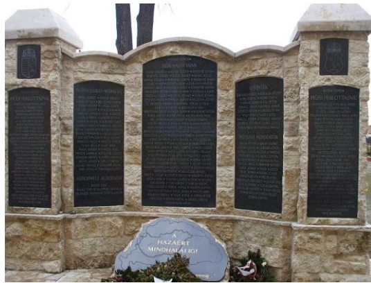
Helyszín: Kecskemét –Hetényegyháza